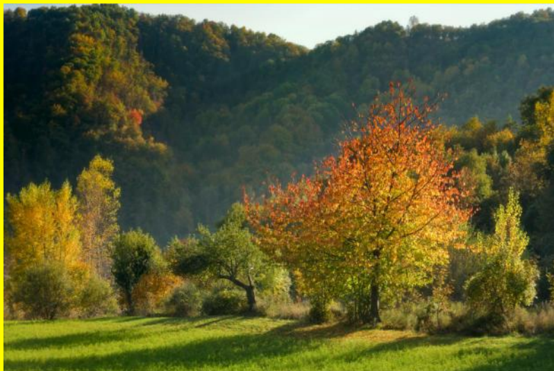
I colori dell'autunno lungo la Val d'Aneva