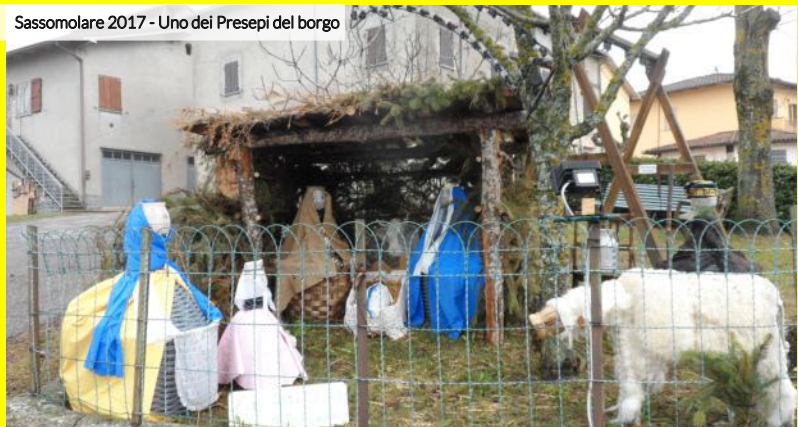
Sassomolare 2017 - Uno dei Presepi del borgo

CASTEL D'AIANO "TERRA DI PRESEPI" Presepi artistici nel Capoluogo, a Villa d'Aiano e nelle altre frazioni oltre che al Parco delle Grotte di San Cristoforo. La vigilia Babbo Natale porterà i doni ai bambini nelle piazze del Comune.