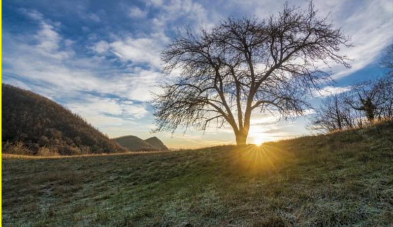
Una fredda alba su Rocca di Roffeno