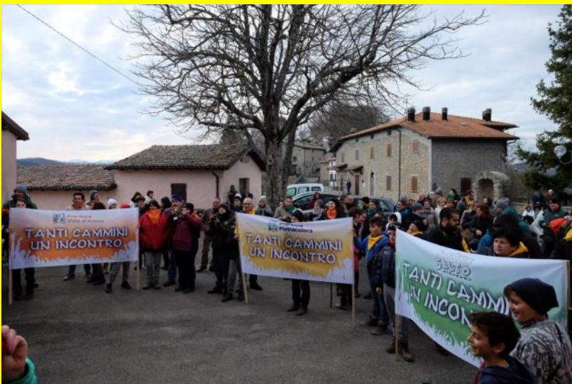
Arrivo a Sassomolare nella prima edizione

Tre percorsi che partono da località differenti per convergere e ritrovarsi, testimoniando che ogni diversità può unire! Associazione Insieme per la tradizione di Pietracolora, Pro Loco di Villa d'Aiano, Associazione Salto 2000 e RDM Radio Dimensione Musica con il patrocinio dei comuni di Castel d'Aiano, Montese e Gaggio montano